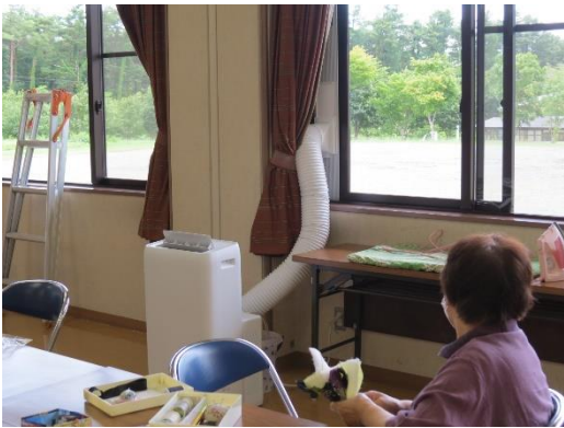
研修室でのパッチワーク教室でクーラー稼働中

撤去すると通告されてすぐに別の業者さんに相談はしていたのだが、新しい自販機が設置されたのは4月の末だった。その間約一か月、